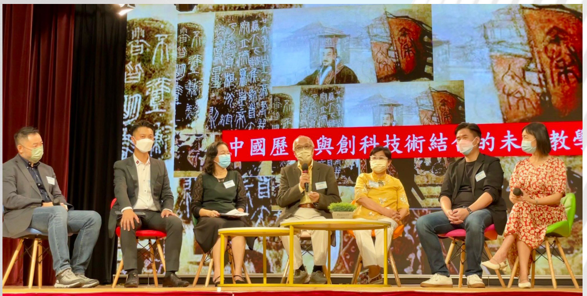
▲ 科創與學科的連結介紹