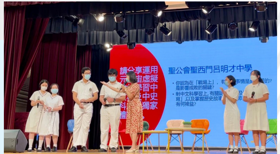
▲ 學生在大會上的演譯環節