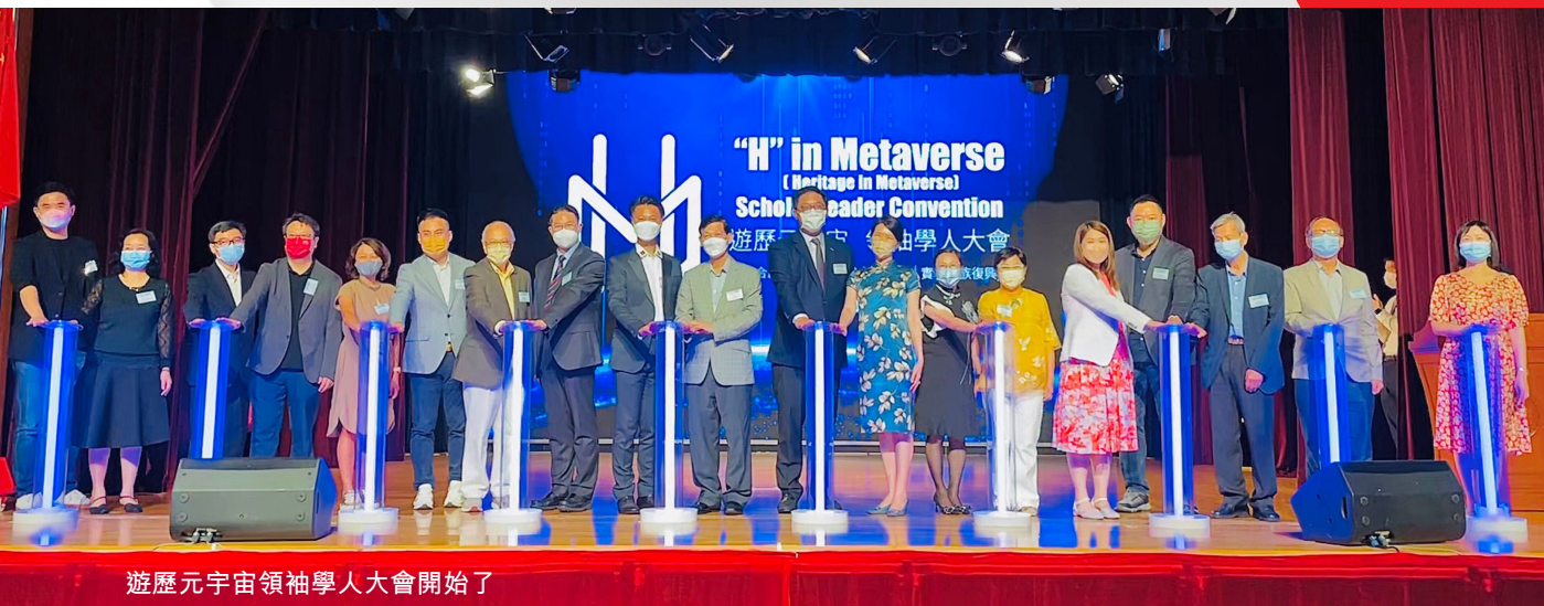
遊歷元宇宙領袖學人大會開始了